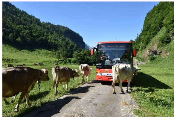
Bus alpin Engstlenalp (Bus alpin)

12:38 Mit Bus oder zu Fuss zum Bahnhof Interlaken Ost