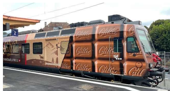
Golden Pass Express am Thunersee (Urs Jossi) Chocolat Express Cailleur TPF (Westiform)