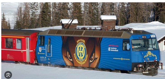
Eishockey-Fanzug der RhB und SOB