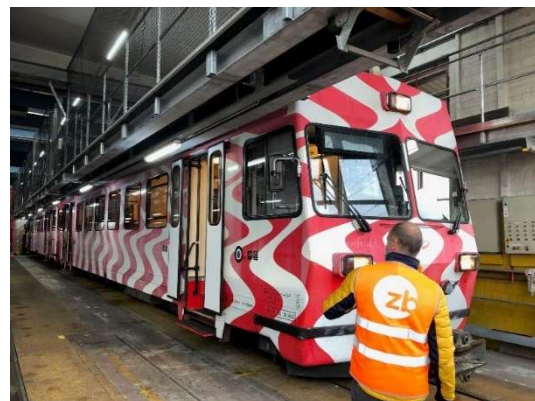
zb Testzug für zahnradlosen Betrieb (zb)